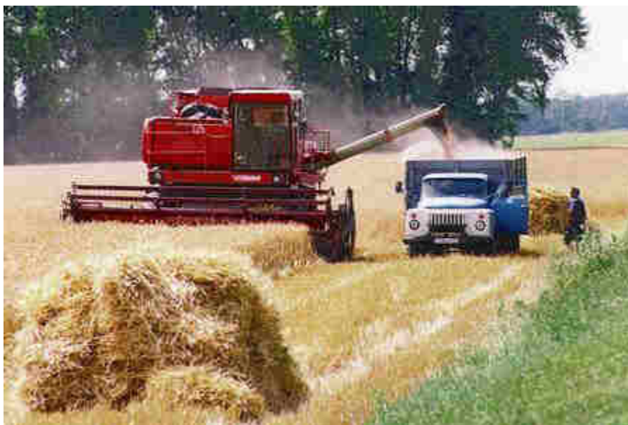
Tabelul 35. Recoltarea producției agricole în raionul Briceni 2012-2013

Au prezentat rapoarte de activitate în agricultură 118 întreprinderi ce prelucrează o suprafață de terenuri agricole egală cu 23740 ha din care teren arabil 20034 ha. Pe teritoriul raionului Briceni în anul 2013 au fost sădite plantații noi de livadă în mărime de 297 ha, în raport cu anul 2012 suprafața sădită e de 2,1 ori mai mare.